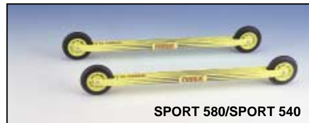
SPORT 580/SPORT 540